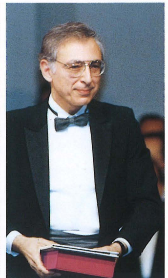
ロバート・C・ギャロ博士