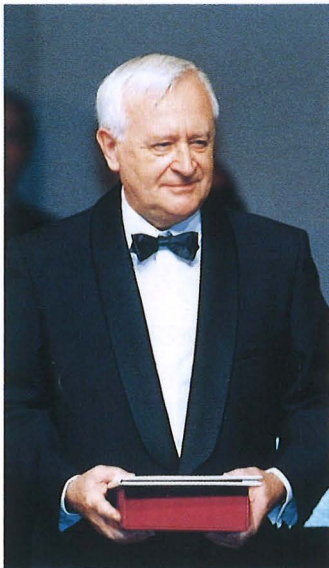
ジョルジュ・バンドリエス博士 〈エネルギー技術分野： 高速増殖炉の実用技術の確立〉