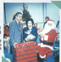
今なお研究所員の子供達にクリスマスプレゼ ントを贈ることは、ジョンズ ホプキンス時 代から始まった習慣です。 Giving Christmas presents to the children of the researchers and staff was a tradition the two doctors started at the Johns Hopkins University.