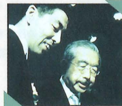
1974年、博士は恩賜賞を受けられました。 昭和天皇に研究をご説明されていると ころです。 In 1974, he was awarded the Imperial Prize. He is explaining his research work to the Showa Emperor.