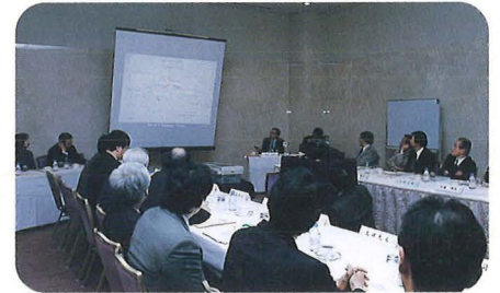
学術懇談会（4月29日） Academic Discussion