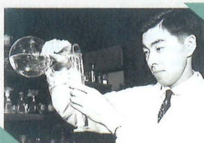
「日本の頭脳」という番組に出演された ときの博士。 A scene from a Japanese TV program called "Japanese Brains".