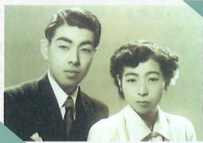
石坂博士は24才の時に照子さんと ご結婚されました。 Dr. Ishizaka married Teruko at the age of 24.