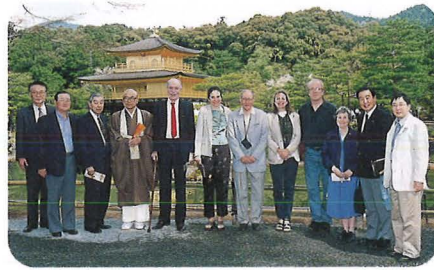
京都の休日（4月30日） Holiday in Kyoto