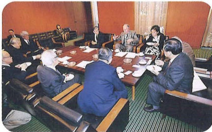
日本学士院訪問（4月25日） Courtesy Call on the Japan Academy