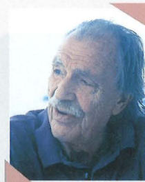
自宅できつろがれている教授です。 At home in 1998.