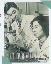
1972年、ジョンズ ホプキンスの 研究室で。 In 1972, at the Johns Hopkins University Labs.