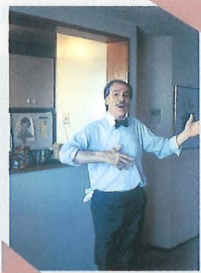
1987年。パークレーで休暇を楽しむ教授。 On sabbatical at Berkeley in 1987.