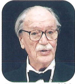
イアン・L・マクハーグ博士 Prof. Ian L. McHarg