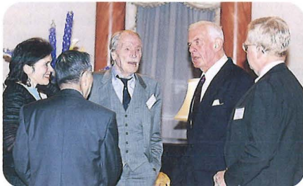
アメリカ合衆国大使夫妻主催パーティー（4月25日） Reception Party hosted by the U. S. Ambassador