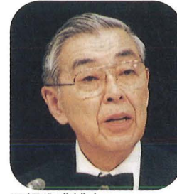
石坂公成博士 Dr. Kimishige Ishizaka

国内・国外の学者、研究者により受賞候補者の推薦がなされ、財団に設置された「日本国際賞審査委員会」により、公正かつ厳正な審査が行われます。その結果を踏まえ、最終的に財団理事会において受賞者を決定いたします。