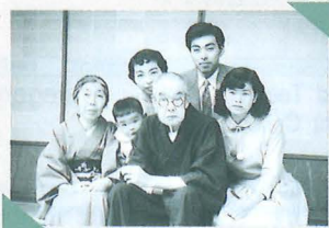
1957年、博士は米国へ留学されました。 留学前にご両親とご一緒に。 In 1957, he and his family visited his parents before they moved to the United States to study there.