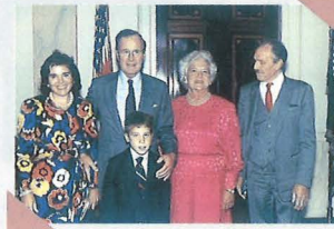
1990年。National Medal of Art 賞 をブッシュ大統領夫妻から受けら れた後の記念撮影です。 After accepting the National Medal of Art from President George Bush and First Lady Barbara Bush in 1990.