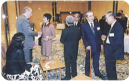
受賞者歓迎レセプション（4月25日） Welcome Reception