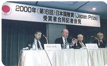
合同記者会見（4月26日） Joint Press Meeting