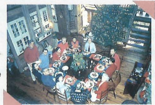
1994年のクリスマスのお祝い でご家族と一緒に過ごす教授です。 A family gathering to celebrate Christmas in December 1994.