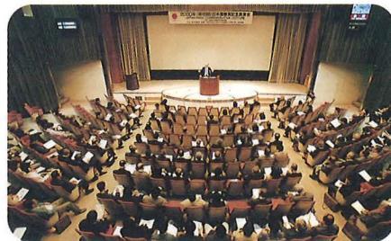
記念講演会（4月26日） Commemorative Lectures