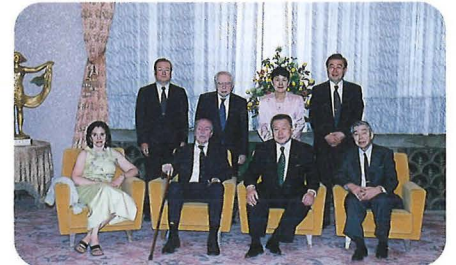
内閣総理大臣表敬訪問（4月27日） Courtesy Call on the Prime Minister

The week of April 24 to May 1, 2000, was designated Japan Prize Week with many events such as visits to the Prime Minister at his office and to the Japan Academy, commemorative lectures, and the culminating Japan Prize Ceremony and Banquet.