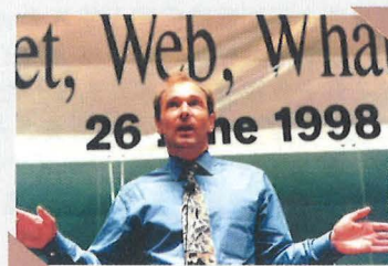
1998年の WWW の会議で発表する博士です。 In 1998, WWW conference.

オックスフォード クイーンズカレッジ一年生の時の物理と数学の試験のあと。学生友達との1こまでです。博士は中央にいます。 With his friends after the first year Physics and Mathematics examinations at the Queen's college at Oxford University. He is in the center.