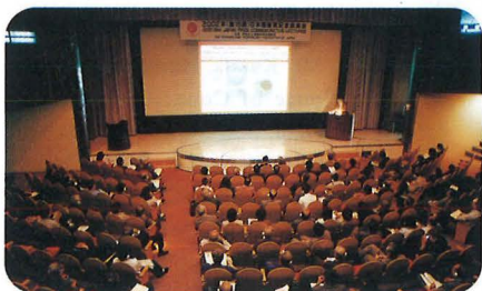
記念講演会 (4月23日) Commemorative Lectures, April 23