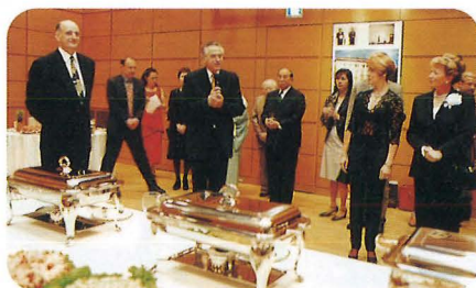
ポーランド大使館パーティー (4月23日) Reception Party hosted by the Polish Embassy, April 23