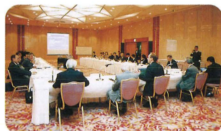
学術懇談会 (4月26日) Academic Discussions, April 26

The week of April 22 to 27, 2002 was designated as "Japan Prize Week" with many events.