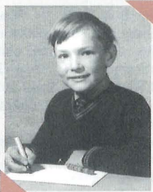
1960年当時の博士です。 Dr. Berners-Lee in 1960.