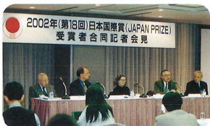
2002年(第18回)日本国際賞(JAPAN PRIZE) 受賞者合同記者会見 合同記者会見 (4月22日) Joint Press Conference, April 22