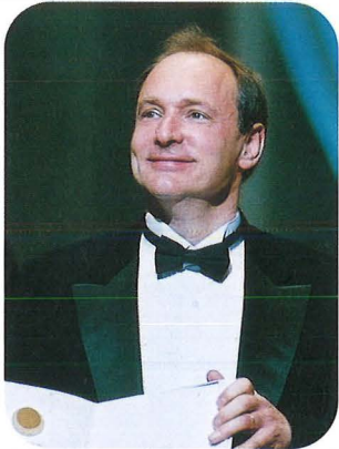
ティモシー・J・バーナーズリー博士 Dr. Timothy John Berners-Lee