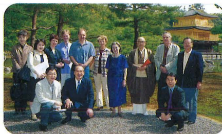
京都の休日 (4月27日) Holiday in Kyoto, April 27