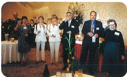
受賞者歓迎レセプション (4月22日) Welcome Reception, April 22