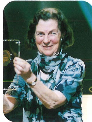
アン・マクラレーン博士 Dr. Anne McLaren