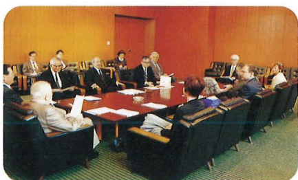
日本学士院表敬訪問 (4月23日) Courtesy Call on The Japan Academy, April 23