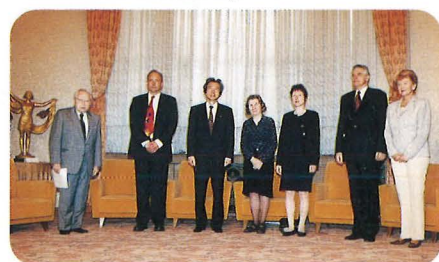
内閣総理大臣表敬訪問 (4月24日) Courtesy Call on Prime Minister, April 24