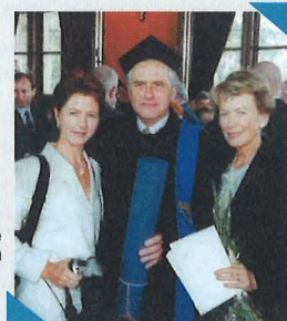
2000年、名誉博士号を受けられました。ご家族と一緒に祝いです。 With his family after receiving the Honorary Doctor's degree from an university in Poland in 2000.