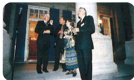
英国大使館パーティー (4月24日) Reception Party hosted by the U.K. Embassy, April 24